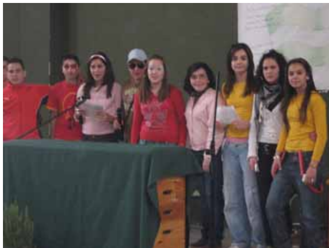
Los autores de la lectura poética organizada por el Departamento de Lengua y Literatura.