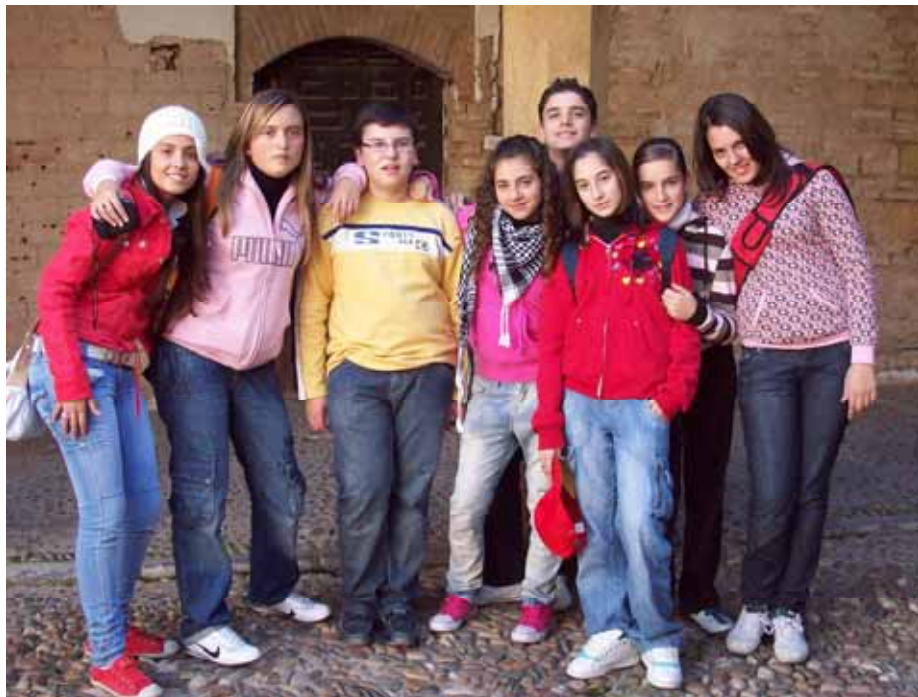
Algunos de los compañeros que fueron a visitar Córdoba