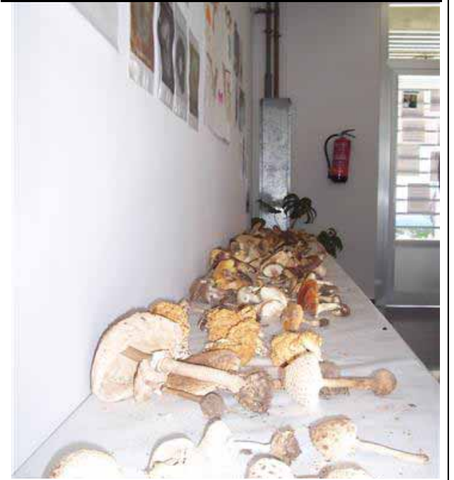
Setas, fichas explicativas, recetas, curiosidades

En ella se encontraban diferentes clases de setas y fichas pegadas en las paredes donde se explicaba si eran venenosas o no, cuáles eran sus nombres vulgares y científicos, etc. También había recetas de cómo cocinar las setas, fotografías, explicaciones de las partes de una seta y de su ciclo de vida.