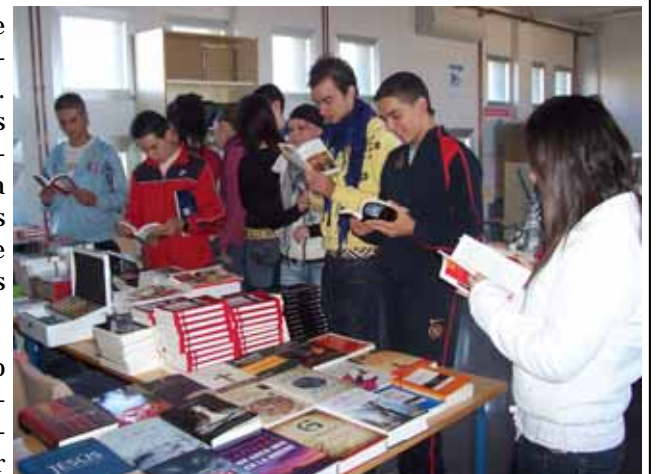
Los autores de esta Hoja Informativa visitando la feria

La Feria del libro lleva ya ocho años realizándose en nuestro Instituto y es una de las actividades enmarcadas dentro del Proyecto Lector del centro.