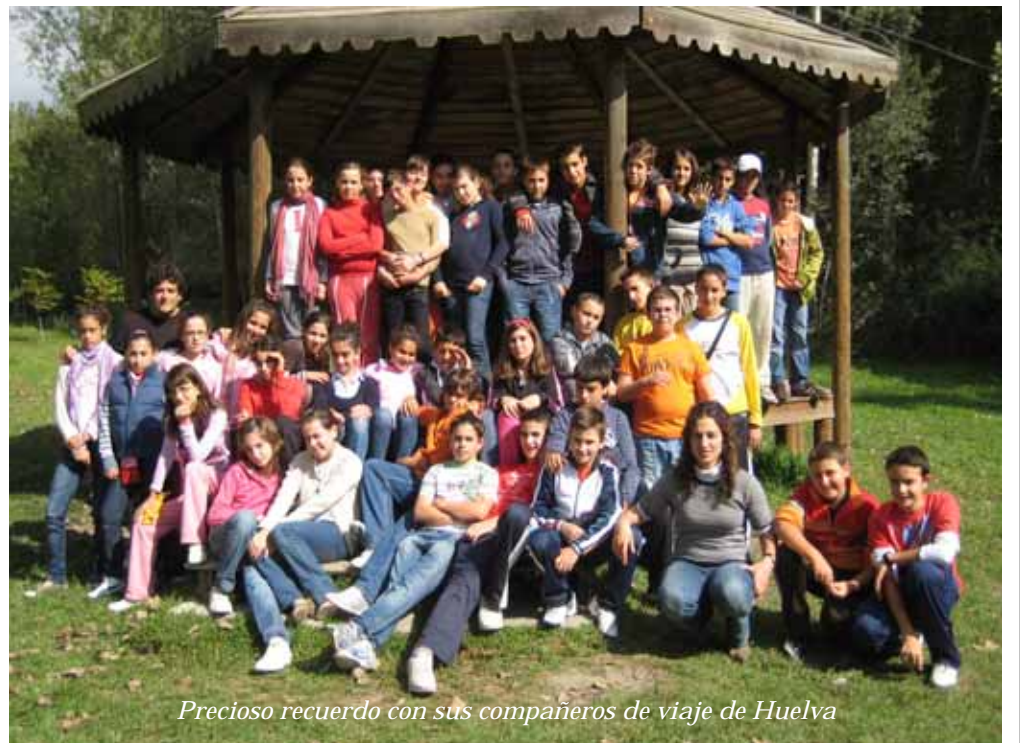
Precioso recuerdo con sus compañeros de viaje de Huelva