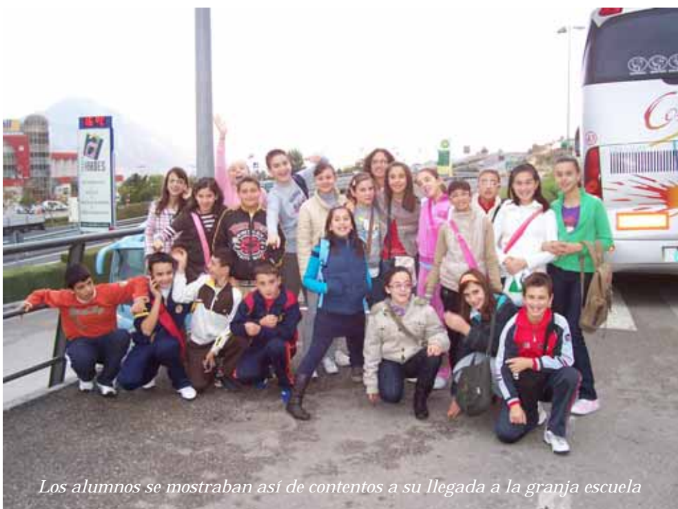
Los alumnos se mostraban así de contentos a su llegada a la granja escuela

Cártel promocionando la nueva norma que pretende mantener la tranquilidad en los pasillos durante los cambios de clase.