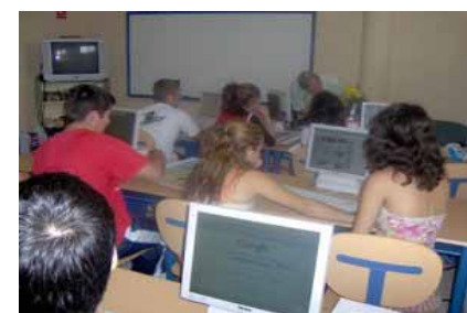
Así quedarán nuestras aulas TIC